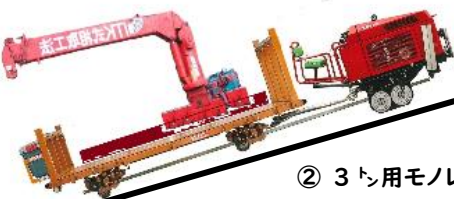
② 3 トン用モノレールで定置式クレーン (2.8 トン) を運ぶ