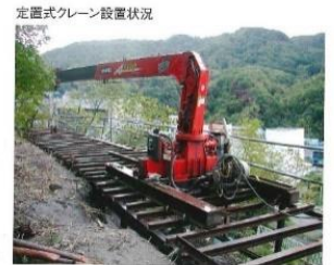
定置式クレーン設置状況