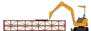
① モノレールでバックホウをあげ H 鋼反力台を設置する